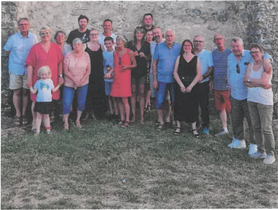
Les habitants des hameaux